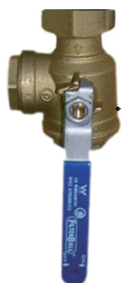
Guľový uzáver 1" s filtrom