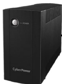
Záložný zdroj UPS, 230 V, 800 VA / 480 W